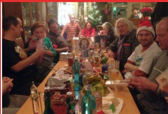
Am Tisch gab es nur noch Stehplätze.